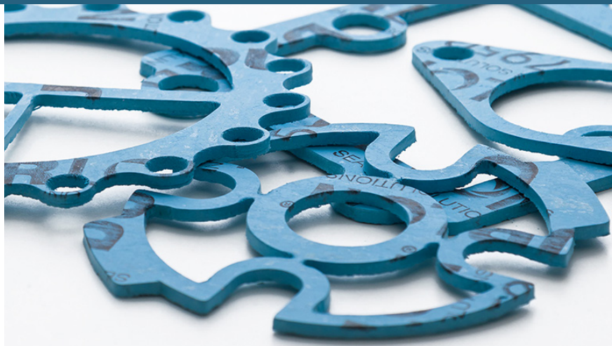
Lámina comprimida de aramida libre de asbesto y con aglomerante de caucho NBR para empaquetaduras ASTM F104: F712120-A9B3E22K5L151M5

Durlon® 7950 es una lámina de servicio general y económica para empaquetaduras hecha con aglomerante NBR (caucho de nitrilo butadieno), ideal para servicios moderados en tuberías y equipos. Con aplicaciones en vapor, hidrocarburos y refrigerantes, y una alternativa cuando la temperatura y la presión son inferiores a 260 °C y 1200 psig (véase la gráfica P x T para validar la información).