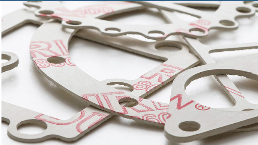
Lámina comprimida de aramida/inorgánica libre de asbesto y con aglomerante de caucho SBR para empaquetaduras ASTM: F712440-A9B3E24K5L152M5

Durlon® 8600 es una lámina comprimida de alta calidad para empaquetaduras, ideal para las industrias de procesos, como de pulpa y papel, generación eléctrica, petroquímicas, así como en industrias generales donde suele necesitarse una empaquetadura “blanca” al trabajar con alimentos y bebidas, fármacos y plásticos.