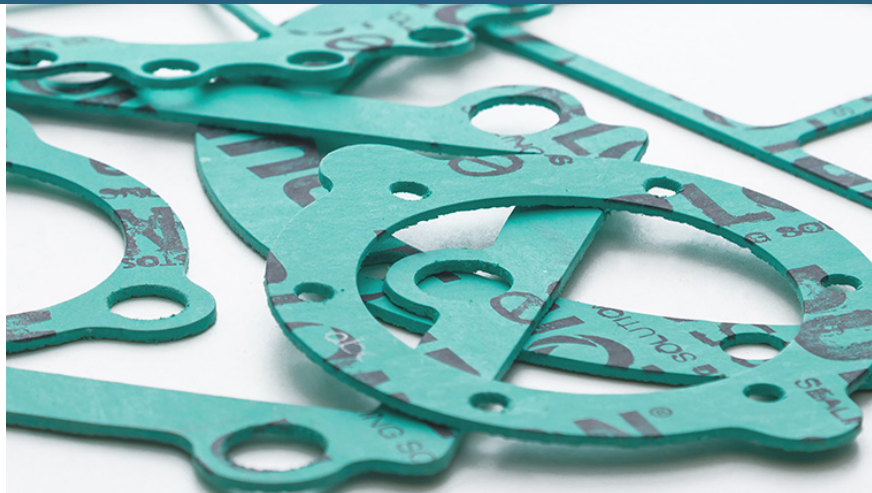
Lámina comprimida de aramida libre de asbesto y con aglomerante de caucho NBR para empaquetaduras ASTM F104: F712120-A9B3E22K5L151M5

Durlon® 7925 es una lámina de servicio general y económica para empaquetaduras hecha con aglomerante NBR (caucho de nitrilo butadieno), ideal para servicios moderados en tuberías y equipos. Con aplicaciones en vapor, hidrocarburos y refrigerantes, y una alternativa cuando la temperatura y la presión son inferiores a 260 °C y 1200 psig (véase la gráfica PxT para validar la información).