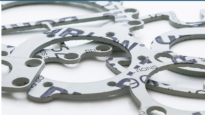
Lámina comprimida de aramida libre de asbesto y con aglomerante de caucho NBR para empaquetaduras ASTM F104: F712120-A9B3E22K5L151M5

Durlon® 7900 es una empaquetadura en lámina de servicio general y económica hecha con aglomerante NBR (caucho de nitrilo butadieno), ideal para servicios moderados en tuberías y equipos. Con aplicaciones en vapor, hidrocarburos y refrigerantes, y una alternativa cuando la temperatura y la presión son inferiores a 500 °F (260 °C) y 1200 psig (véase la gráfica P x T a continuación para validar la información).