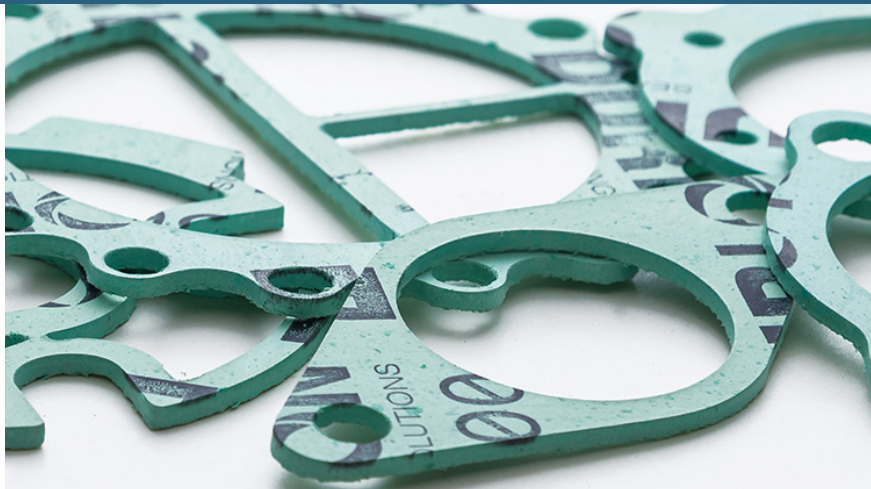
Lámina comprimida sin asbesto de alta calidad comercial y con buena resistencia química, ideal para condiciones de servicio moderadas. Apta para aceite, agua, álcalis suaves, ácidos suaves, hidrocarburos y solventes.

Lámina comprimida de fibra mineral libre de asbesto y con aglomerante de caucho NBR para empaquetaduras ASTM F104: F712120-A9B4E12K5L051M5